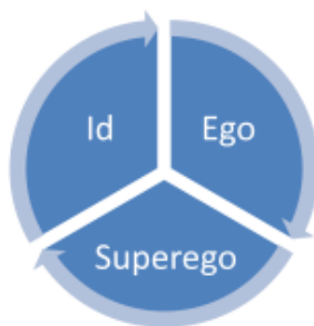
Freud psychodynamic approach to personality

Entre os anos 1920 e 1923, Dr Freud deu um novo norte a suas pesquisas e teorias, remodelando a teoria do aparelho psíquico, nesse período, introduz novos conceitos. São eles: id , ego e superego . Para Freud, tais teorias permitiam-lhe referir-se a tríade da personalidade humana. Nas linhas seguintes, buscaremos apresentar a referida tríade de forma separada. Vejamos: